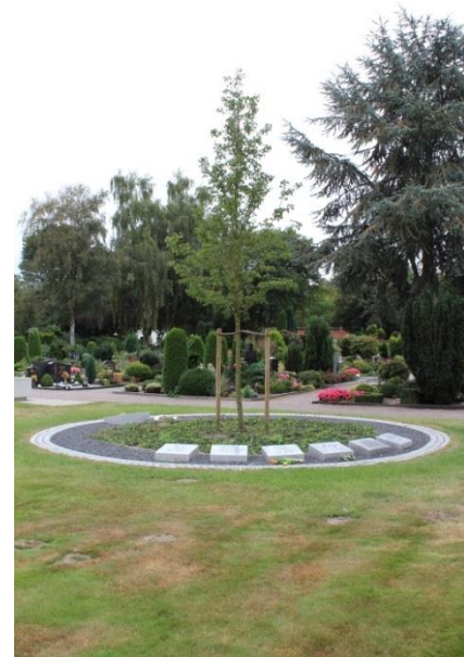
Innenring: Bepflanzung u.a. mit Chinesischer Birne Außenring: Kiesbeet mit Grabstein und Pflasterrand