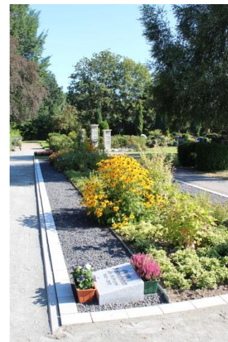
Mittelstreifen bepflanz außen: Kiesbeet mit Grabstein Pflasterrand