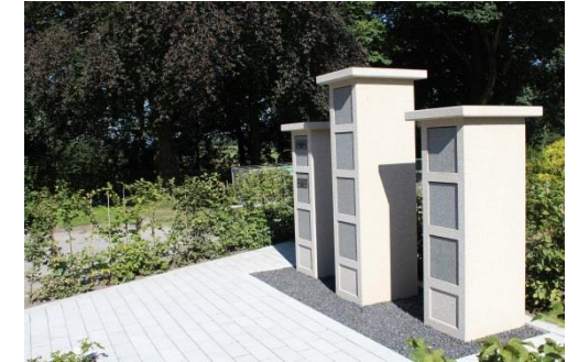
3 Stelen mit 3 oder 4 Kammern für je 2 Urnen Verschlussplatte bepflanztes Umfeld, Bank, Pflasterung

Die Herrichtung der Grabstätte mit Stele und Beschriftung der Stele, die Pflege der Grabstätte, Nachpflanzungen und FUG* für zunächst 30 Jahre.