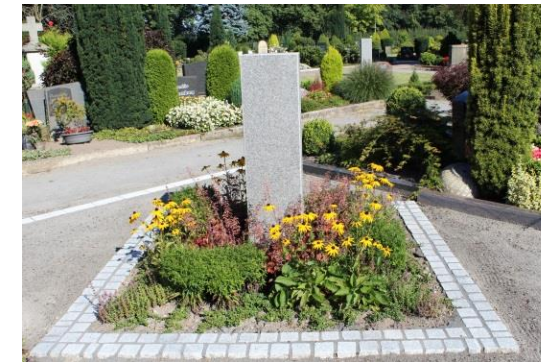
4 Urnenpartnergräber, je Partnergrab ein Dreieck, bepflanzte, mittig: Stele mit Schriftplatte zur Grabseite hin

Die Beschriftung des Grabsteines wird extra berechnet.