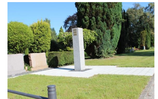
rechts/links: Rasen für jeweils 20 Urnen, insgesamt 40 mittig: Im Pflaster eine Stele für Messingschilder mit Daten der Verstorbenen.

In der Gebühr ist die Rasenpflege enthalten.