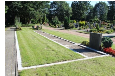
oben: Pflanzstreifen mit Grabstein unten: Rasen