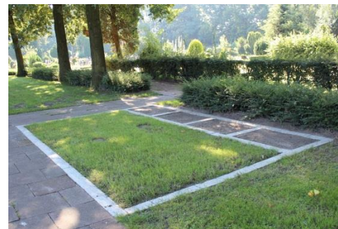
oben: Pflanzstreifen mit Grabstein unten: Rasen

Erwerb für 25 Jahre/keine Verlängerung möglich