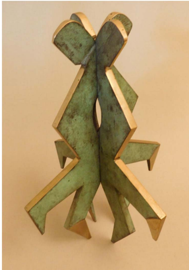
Skulptur „Der Tanz“ – Edwin Partoll