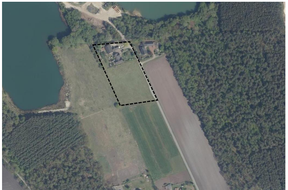
Karte: Luftbild LGLN 2019