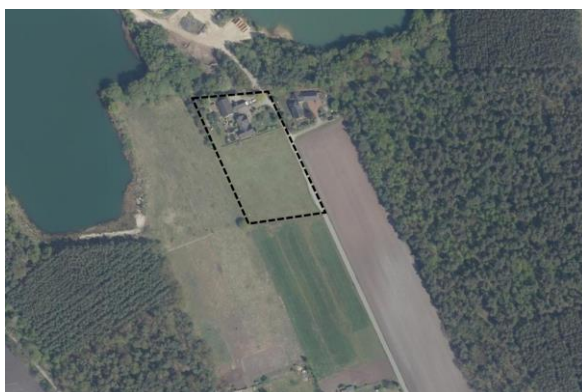
Abb 4 Luftbild des Vorhabenbereichs

Nachfolgend wird der derzeitige Umweltzustand (Basisszenario) dargestellt und eine Prognose über die Entwicklungen des Umweltzustands bei Durchführung der Planung vorgenommen. Soweit möglich, werden auch die wahrscheinlich auftretenden erheblichen Auswirkungen während der Bau- und Betriebsphase berücksichtigt. Zudem wird eine Nullvariante, also die wahrscheinliche Entwicklung bei Nichtdurchführung der Planung, skizziert.